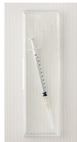
Toute seringue trouvée hors de son coffret de sûreté en plastique est considérée illégale (prison de Hindelbank, Suisse).

Les seringues et aiguilles doivent être rangées dans les boîtes de sûreté en plastique fournies par l'unité de santé.