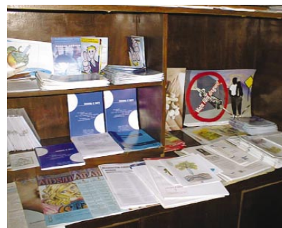
Information sur la réduction des méfaits et la prévention du VIH (Prison Colony 18, Branesti, Moldavie).

Dans les 11 prisons du Kirghizstan, le nombre de détenus vivant avec le VIH/sida s'est accru régulièrement en quelques années. En 2000, on ne comptait que trois cas connus de VIH