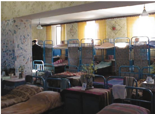
Les programmes d'échange de seringues s'avèrent efficaces aussi dans des établissements pénitentiaires en caserne, comme la Prison Colony 18, à Branesti, Moldavie.

La mise en œuvre réussie de programmes d'échange de seringues tient compte non seulement de la taille, du niveau de sécurité et de la structure des établissements hôtes, mais aussi des besoins de leurs populations carcérales. Dans les six pays examinés, de telles initiatives ont été initiées en réponse à des taux élevés de VIH et/ou d'injection de drogue en prison. Dans chaque ressort à l'étude, une fois ce besoin reconnu, les prisons ont fait preuve de flexibilité et de créativité dans l'introduction d'un programme d'échange de seringues adapté aux besoins de leur population et de leur contexte institutionnel particulier.