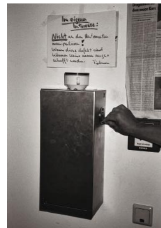
Distributeur automatique de seringues (prison de Lichtenberg, Berlin).

On n'a recensé aucun cas de seringue utilisée comme arme contre des employés ou des détenus, même si plus de 20 000 seringues ont été distribuées dans les deux prisons pendant l'essai pilote. Le taux de respect des règlements du programme était élevé; on n'a compté que quelques infractions mineures liées au rangement inadéquat de seringues, ou à la possession de seringues par des détenus inscrits au programme d'entretien