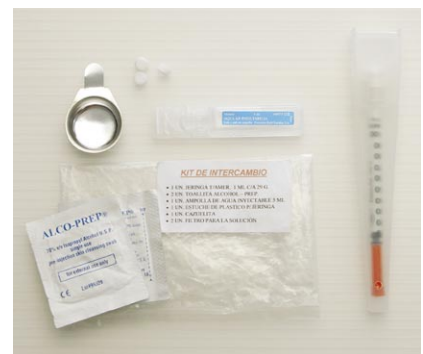
Trousse de réduction des méfaits (prison Soto de Real, Madrid).

La politique veut que les trousse de réduction des méfaits contiennent une seringue dans un coffret de plastique transparent, de l'eau distillée et un tampon alcoolisé.