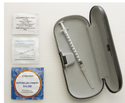
Trousse de réduction des méfaits (prison de Lichtenberg, Berlin).