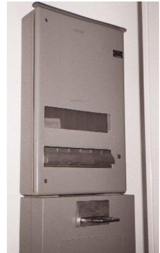
Un distributeur automatique de seringues (prison de Saxerriet, Suisse).

En 1996, un programme d'échange de seringues a été établi dans la prison de Champ Dollon (à Genève) et en 1997 dans celle de Realta (à Graubünden). À Champ Dollon, on utilise le même modèle de distribution qu'à Oberschöngrün (i.e. par le biais de l'unité médicale), alors que Realta a recours à un distributeur automatique. En 1998, des programmes d'échange de seringues ont été mis en œuvre dans les prisons de Witzil et de Thorberg, à Berne, où la distribution est faite par le personnel médical. En 2000, la prison de Saxerriet, à Salez, est devenue la septième prison suisse à fournir des seringues stériles. 133