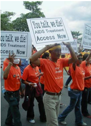
Des manifestants critiquent le slogan de la conférence « Access for All » (Accès pour tous)